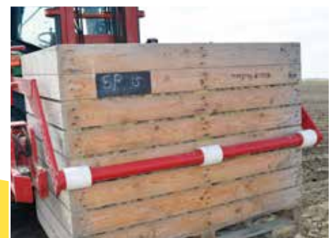
Rotation de 180°