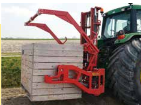
Pinces supérieure "Roll'Over"