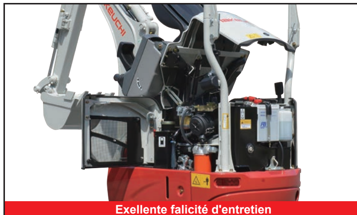
Excellente facilité d'entretien