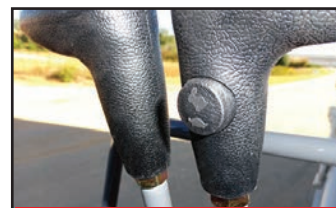
Deux vitesses de translation

La TB210R dispose de nombreuses améliorations dont le confort de l'opérateur l'efficacité et la facilité d'accès pour l'entretien. Pour une plus grande précision et pour réduire la fatigue, la TB210R est équipée de joystick à commande hydraulique qui demandent moins d'effort lors de l'action de l'opérateur.