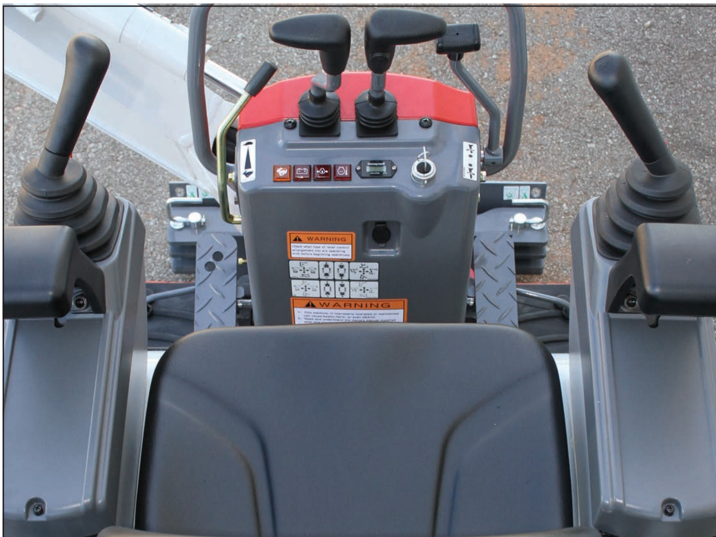
Poste de conduite spacieux et joysticks à commande hydraulique

Afin de limiter les impacts sur le contrepoids, la TB210R a été conçue en rayon court. Malgré ces dimensions compactes, l'accès pour l'entretien reste exceptionnel grâce à son siège inclinable et à ses capots à grande ouverture.