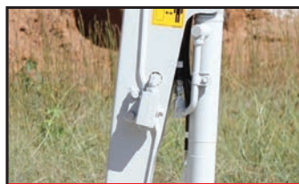
Ligne auxiliaire double effet